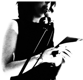
photographie d'Aliette Cosset